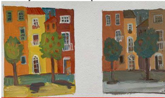
Цвет и настроение