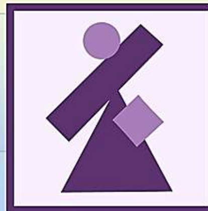
рис. 29 динамика в композиции