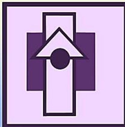
рис. 28 статика в композиции

С помощью 4-5 геометрических фигур создать: а) статичную композицию; б) динамичную композицию;